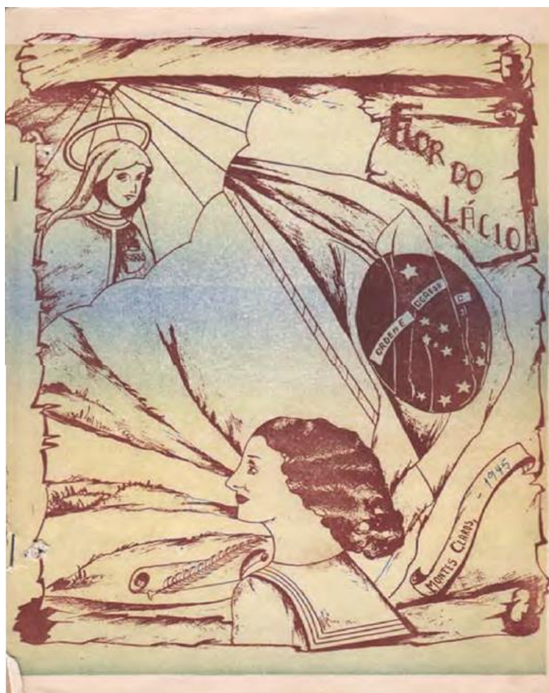
Figura 3 - Capa da revista Flor do Lácio (fascículo n. 5, 1945)