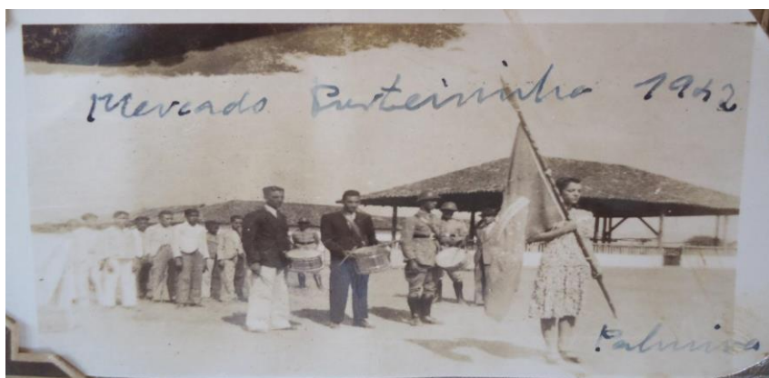
Figura 4 - Desfile cívico em Porteirinha/MG, 1942