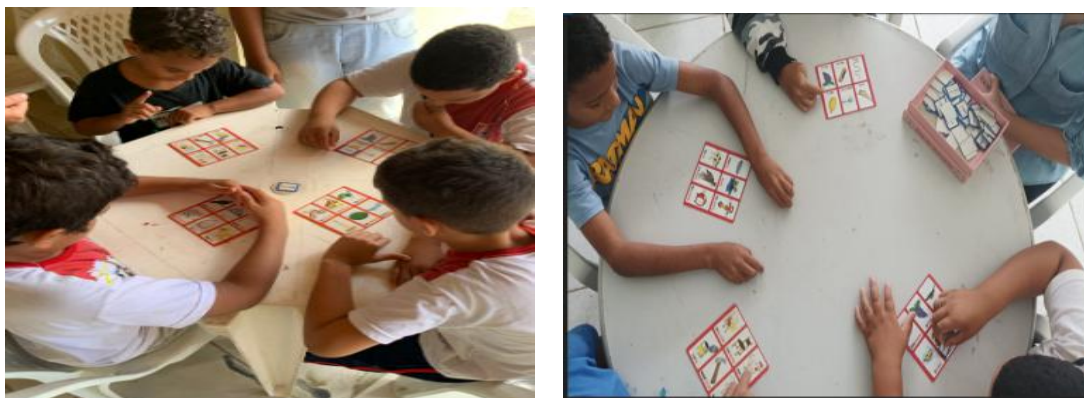
Figura 3 – Jogo bingo dos sons iniciais

Há também fichas com palavras escritas, que são empregadas pelo docente. O jogador deverá marcar a sua cartela até preencher a figura/palavra, cujo som inicial é o mesmo da palavra pronunciada pelo mediador, o que deverá ocorrer até preencher a cartela.