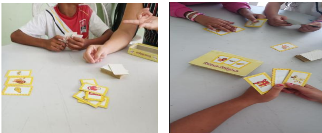
Figura 6 – Jogo trinca mágica

O referido jogo possibilita que os aprendizes analisem as semelhanças sonoras entre as palavras, no caso em questão, as rimas. Logo, o aprendiz é desafiado a formar uma trinca de cartas com as figuras de palavras que rimam. A seguir, são apresentados alguns registros desse jogo.