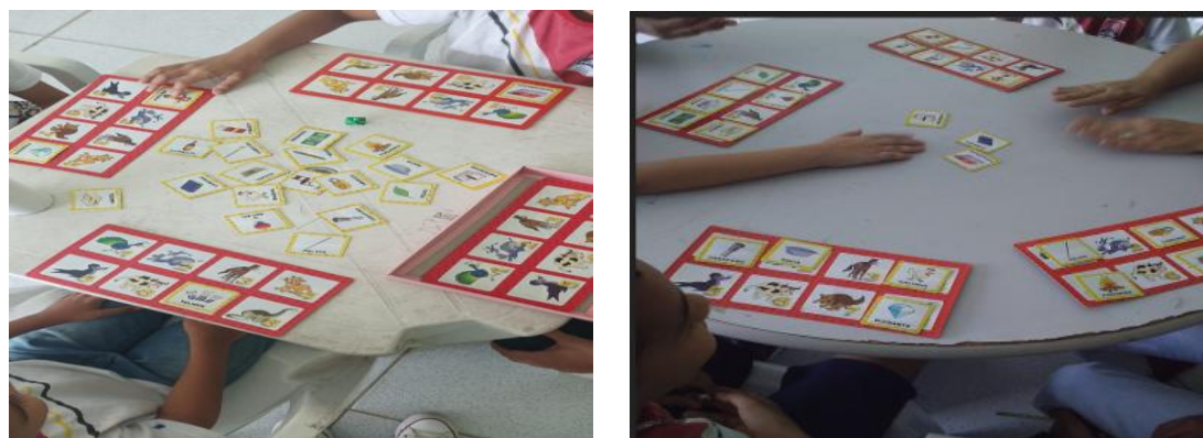
Figura 4 – Jogo dado sonoro

A proposta desse jogo consiste em levar o estudante a perceber que a palavra é composta por sílabas e que essas podem se repetir em palavras diferentes. Esse é um recurso que dispõe de cartelas com imagens e fichas com figuras para o sorteio: “Para cada figura da cartela há três fichas de figuras/palavras, que se iniciam com a mesma sílaba das figuras/palavras apresentadas na cartela” (Brandão et al. , 2009, p. 44). O propósito do jogo é reunir o maior número de fichas.