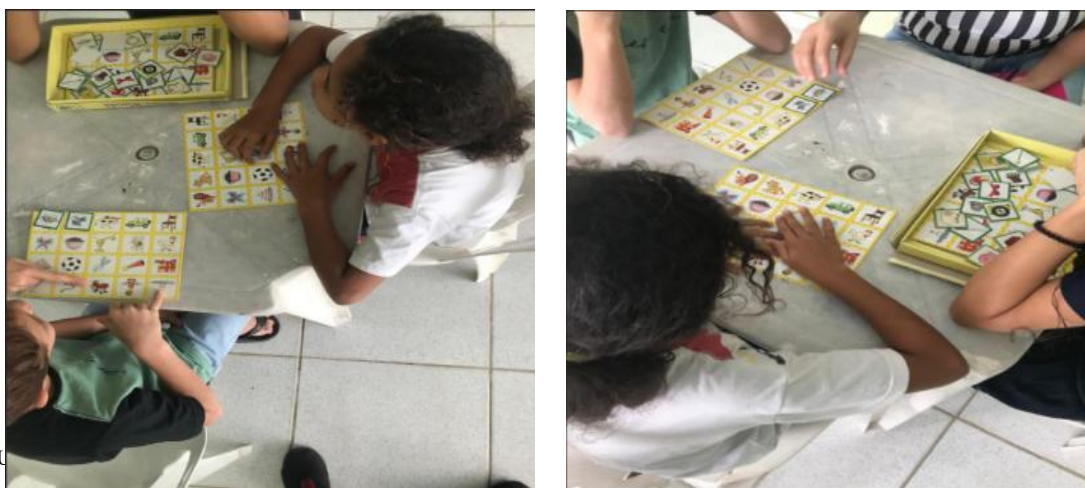
Figura 5 – Jogo caça-rimas

Esse jogo é formado por cartelas e fichas com figuras, de modo “que o aluno descubra que palavras diferentes podem ter o mesmo “pedaço” sonoro final (a rima)” (Brandão et al. , 2009, p. 35). Isso é feito a partir da localização de figuras, cujas palavras rimam com os nomes das figuras que estão na cartela. Como meta, “O jogo é finalizado quando o primeiro jogador encontra o par de todas as fichas que recebeu. Esse jogador deve gritar “parou” e todos devem contar quantas fichas foram colocadas corretamente por cada jogador” (Brandão et al. , 2009, p. 36).