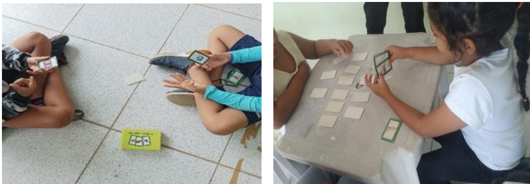
Figura 2 – Jogo batalha de palavras

Esse é um recurso que apresenta algumas fichas com figuras, cujos nomes variam quanto ao número de sílabas. Cabe aos jogadores contar o número de sílabas e comparar o tamanho das palavras a partir das fichas de cada rodada. Vence a batalha o jogador que juntar mais fichas. O tipo de reflexão envolvida nesse jogo ajuda o aprendiz a descobrir que a escrita nota segmentos sonoros das palavras, atentando-se às semelhanças e diferenças sonoras.