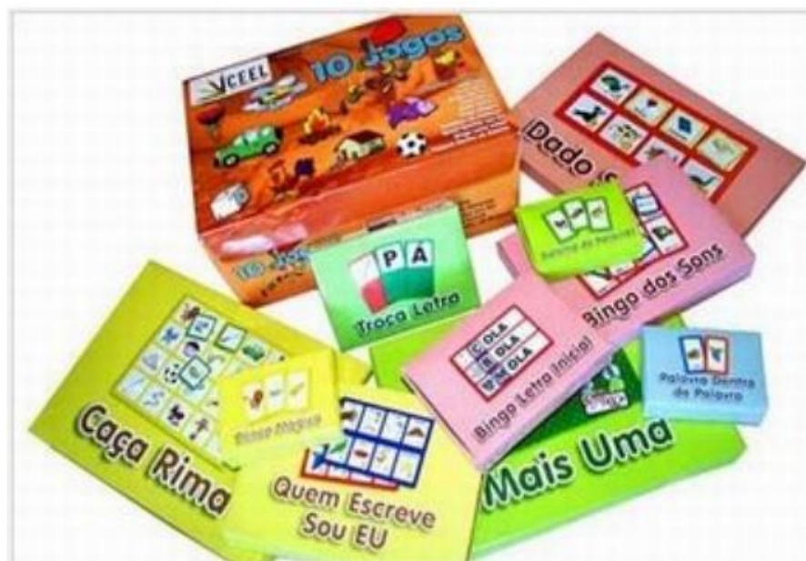
Figura 1 – Caixa de Jogos do CEEL

Como mencionado, no processo de acompanhamento pedagógico das crianças, os jogos de alfabetização ocupam espaço de destaque, sem perder de vista a integração e a articulação desses com os demais recursos adotados. Entre os jogos explorados, optamos pela coletânea produzida pelo Centro de Estudos em Educação e Linguagem (CEEL), da Universidade Federal de Pernambuco (UFPE), a saber: